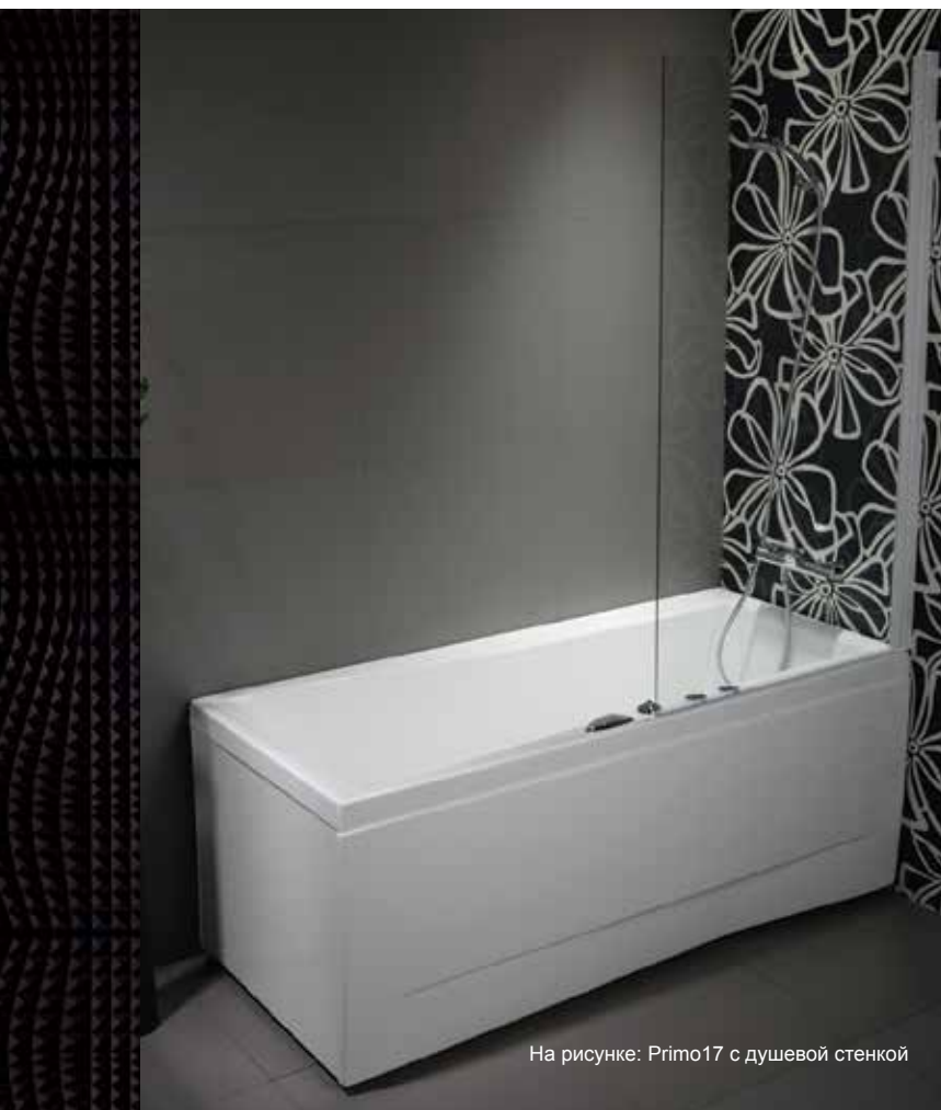
На рисунке: Primo17 с душевой стенкой